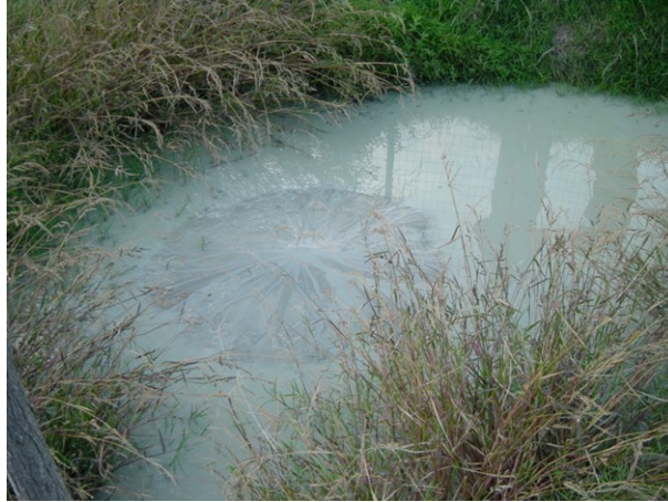
Figura 4. Zona caratterizzata da emissione localizzata (Cellino Attanasio)

evidenti avvallamenti, rigonfiamenti e fratture a varia orientazione (Fig. 5, 6).