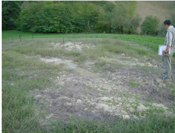
Figura 5. Zona caratterizzata da emissione diffusa (Cellino Attanasio)