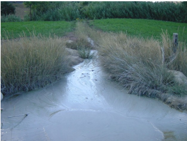
Figura 3 (a) Drenaggio verso il Fosso Calvano dei fluidi emessi dalla sorgente di Pineto

Dalle osservazioni sul campo e dai risultati di laboratorio è emerso quanto segue: la sorgente connessa con il "vulcanello" di Pineto (TE), probabilmente anche la più nota, risulta ubicata lungo la piana alluvionale del Fosso Calvano, in sinistra idrografica, ad una quota di circa 15 m. s.l.m., a pochi metri dalla strada provinciale che da Pineto conduce verso Atri. La zona di emergenza, si configura geometricamente come un apparato sub-conico con un diametro alla base di circa 7 m ed un'altezza di circa 1.5 m che risultano variabili nel tempo in funzione all'alternanza di fasi parossistiche di emissione essenzialmente fluido-gassosa alternati a periodi ad emissione ridotta. Le sue dimensioni risultano peraltro condizionate dall'azione antropica che, drenando la parte fluida del fango, ne impedisce una crescita regolare, con un'azione di drenaggio lineare tendente allo smaltimento dei fanghi verso il fosso Calvano (fig. 3a, b).