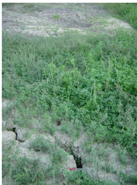
Figura 6. Zona prossima all'emissione diffusa con fratture sul terreno fino a 5 cm (Cellino Attanasio)