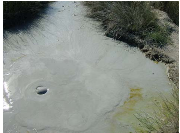
Figura 3 (b) Particolare delle manifestazioni gassose nel punto di emissione

La zona circostante la crescita del vulcanello di fango si è espressa con un blando rigonfiamento del terreno ad ampio raggio, chiaramente visibile rispetto alla circostante piana alluvionale.